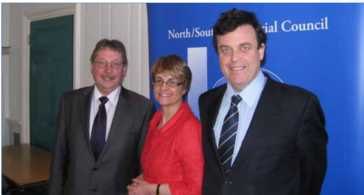
Clé go deas: Sammy Wilson MP, CTR, Aire Airgeadais agus Pearsanra, Margaret Ritchie CTR, Aire Forbartha Sóisialta agus Brian Lenihan TD, Aire Airgeadais.