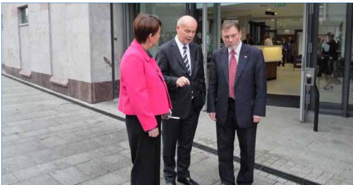
Clé go deas: Caitríona Ruane MLA, Aire Oideachais, Pat Carey TD, Aire Gnóthaí Pobail, Comhionannais agus Gaeltachta agus Nelson McCausland CTR, Aire Cultúir, Ealaíon agus Fóillíochta taobh amuigh d'oifigí nua Chomhrúnaíocht na Comhairle Aireachta Thuaidh Theas.