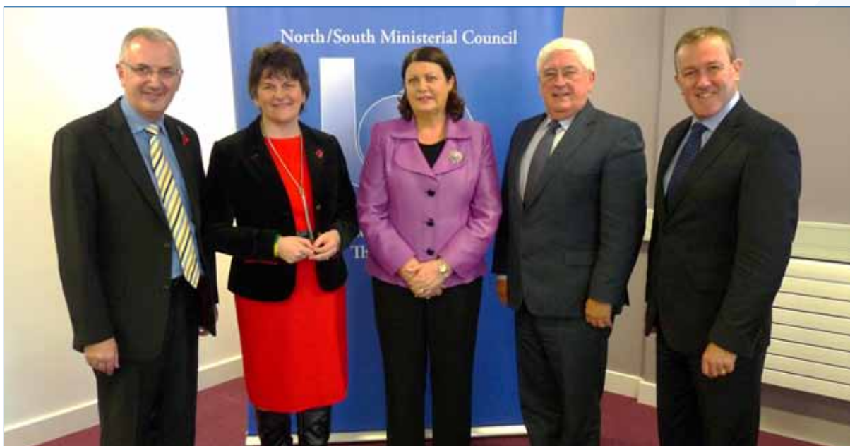
Clé go deas: Danny Kennedy CTR, Aire Fostaíochta agus Foghlama, Arlene Foster CTR, Aire Fiontar, Trádála agus Infheistíochta, an Coimisinéir Eorpach Máire Geoghegan-Quinn, Batt O’Keeffe TD, Aire Fiontar, Trádála agus Nuálaíochta agus Conor Murphy MP, CTR, Aire Forbartha Réigiúnaí