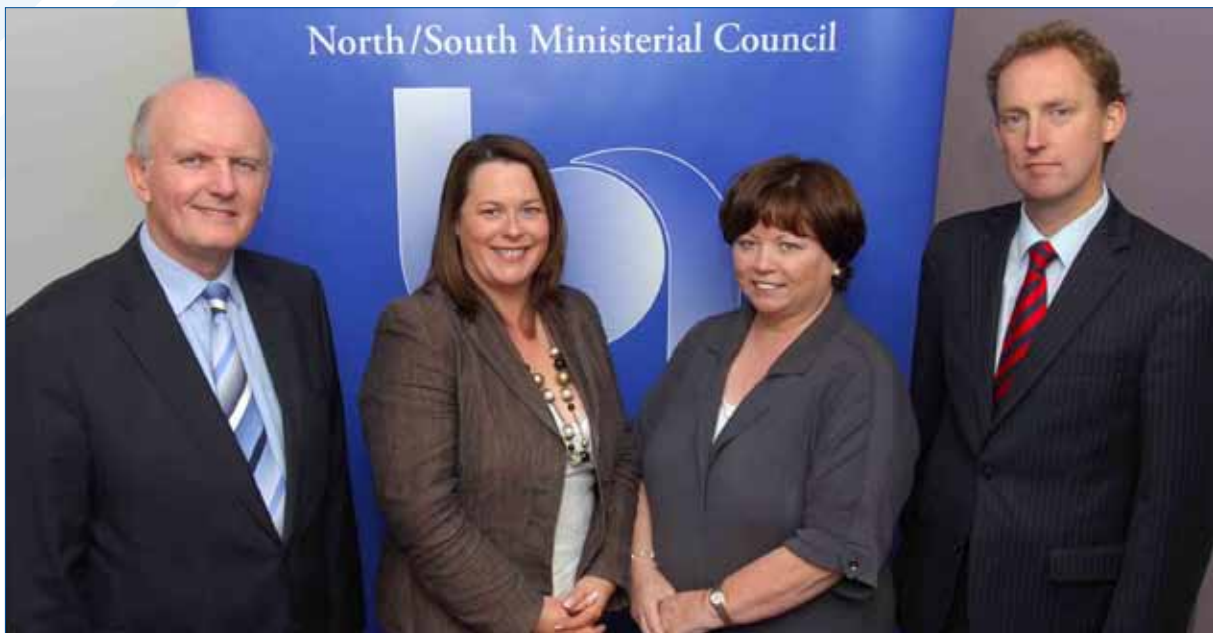
Clé go deas: Michael McGimpsey CTR, Aire Sláinte, Seirbhísí Sóisialta agus Sábháilteachta Poiblí, Michelle Gildernew MP, CTR, Aire Talmhaíochta, Mary Harney TD, Aire Sláinte agus Leanaí agus Barry Andrews TD, Aire Gnóthaí Leanaí agus Óige.

2.4.1 Tháinig CATT le chéile de réir fhormaid na hearnála Sláinte in Ard Mhacha ar 2 Meitheamh agus san lúr ar 10 Samhain. D'fhreastail Michael McGimpsey CTR, Aire Sláinte, Seirbhísí Sóisialta agus Sábháilteachta Poiblí, Michelle Gildernew MP, CTR, Aire Talmhaíochta agus Forbartha Tuaithe agus Barry Andrews TD, Aire Gnóthaí Leanaí agus Óige ar an dá chruinniú. D'fhreastail Mary Harney TD, Aire Sláinte agus Leanaí ar an chruinniú i mí an Mheithimh.