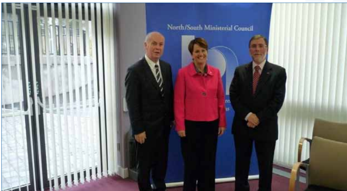
Clé go deas: Pat Carey TD, Aire Gnóthaí Pobail, Comhionannais agus Gaeltachta, Caitriona Ruane CTR, Aire Oideachais agus Nelson McCausland CTR, Aire Cultúir, Ealaíon agus Fóillíochta.