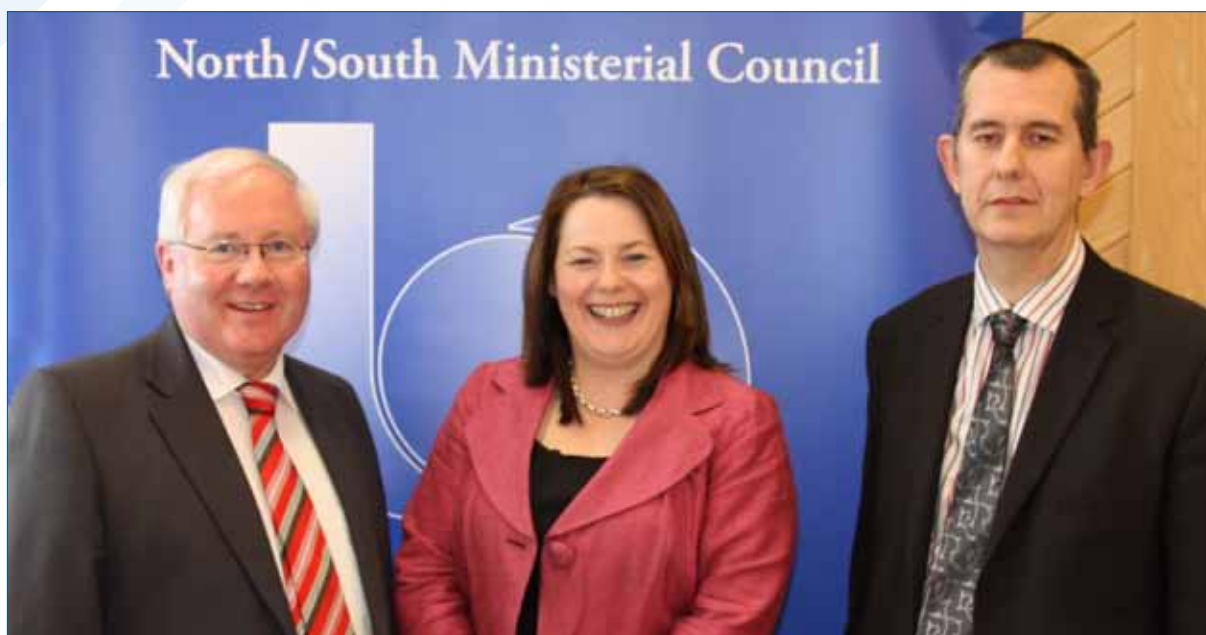
Clé go deas: Brendan Smith TD, Aire Talmhaíochta, Iascaigh agus Bia, Michelle Gildernew MP, CTR, Aire Talmhaíochta agus Forbartha Tuaithe agus Edwin Poots CTR, Aire Comhshaoil.

2.1.1 Tháinig CATT le chéile de réir fhormaid na hearnála Talmhaíochta i gCromghlinn ar 31 Márta agus i mBaile Átha Cliath ar 13 Deireadh Fómhair. Bhí Brendan Smith TD, Aire Talmhaíochta, Iascaigh agus Bia, Michelle Gildernew MP, CTR, Aire Talmhaíochta agus Forbartha Tuaithe agus Edwin Poots CTR, Aire Comhshaoil, i láthair ag an dá chruinniú. Bhí Pat Carey TD, Aire Gnóthaí Pobail, Comhionannais agus Gaeltachta ar an chruinniú i mí Dheireadh Fómhair.