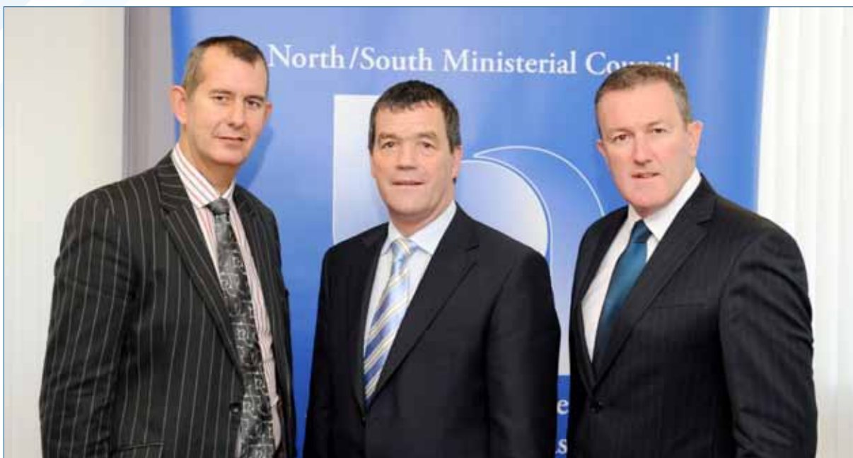
Clé go deas: Edwin Poots CTR, Aire Comhshaoil, Noel Dempsey TD, Aire Iompair agus Conor Murphy MP, CTR, Aire Forbartha Réigiúnaí.

2.6.1 Tháinig CATT le chéile de réir fhormaid na hearnála iompair san Iúir ar 3 Márta agus in Ard Mhacha ar 20 Deireadh Fómhair. D'fhreastail Noel Dempsey TD, Aire Iompair, Edwin Poots CTR, Aire Comhshaoil agus Conor Murphy MP, CTR, Aire Forbartha Réigiúnaí ar an dá chruinniú.