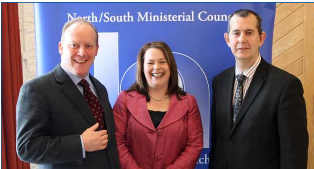
Clé go deas: Conor Lenihan TD, Aire Stáit um Acmhainní Nádúrtha, Michelle Gildernew MP, CTR, Aire Talmhaíochta agus Forbartha Tuaithe agus Edwin Poots CTR, Aire Comhshaoil.

2.7.1 Tagann CATT le chéile de réir fhormaid earnála an Dobharshaothraithe agus Muirí chun cinntí a dhéanamh maidir le polasaithe agus gníomhartha atá le cur i bhfeidhm ag Coimisiún an Fheabhail, Chairlín agus Shoilse na hÉireann (CFCSÉ). Tá 12 chomhalta Boird ag CFCSÉ, iad ceaptha ag CATT. Feidhmíonn an Bord de réir fheidhmeanna an fhorais maidir le ceantair an Fheabhail agus Chairlín trí Gníomhaireacht na Loch.