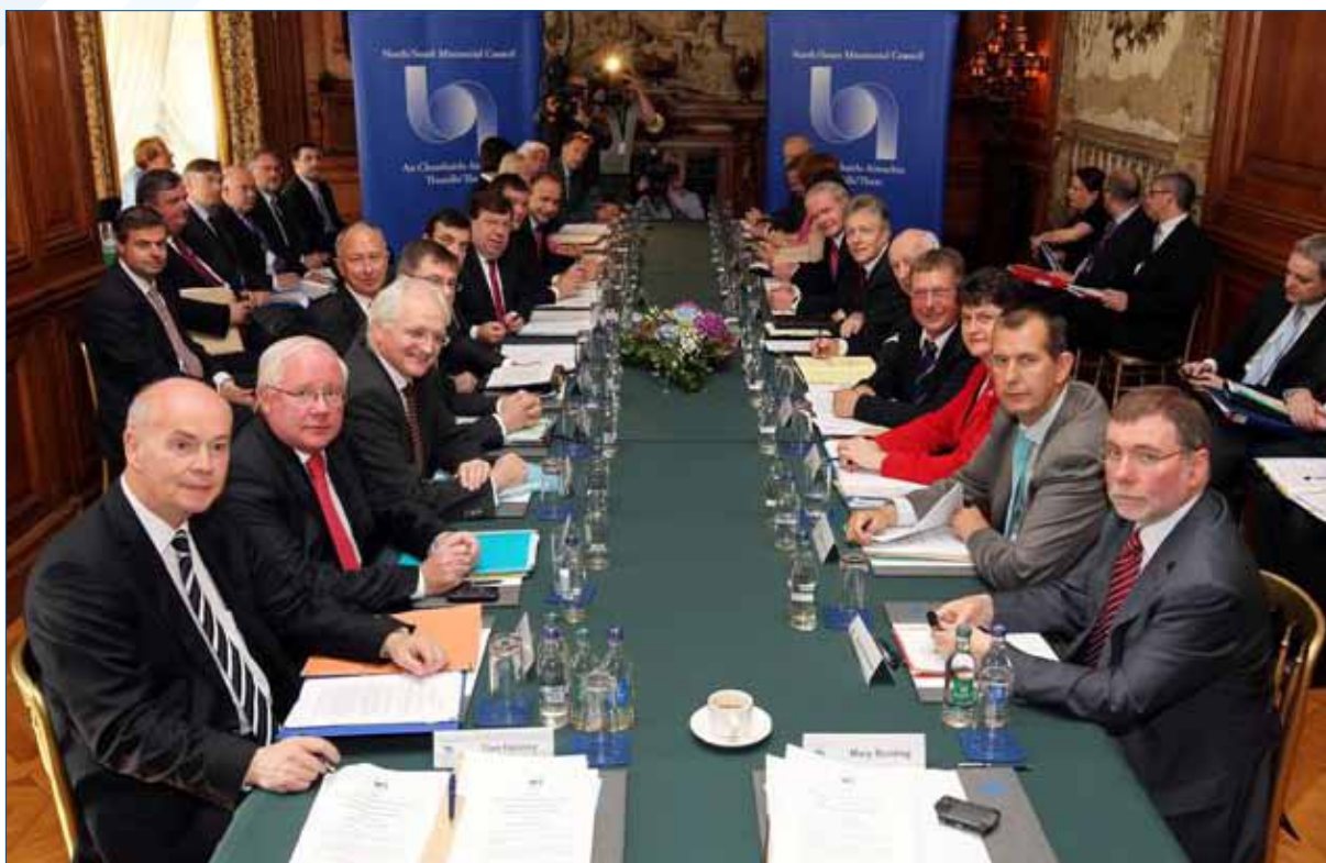
Airí ag an deichiú cruinniú iomlánach de chuid CATT ar 5 Iúil 2010, Teach Farmleigh, Baile Átha Cliath

1.1 Tháinig CATT le chéile faoi choinne cruinniú iomlánach ar 5 Iúil i dTeach Farmleigh, Baile Átha Cliath. Ba é an Taoiseach Brian Cowen TD a bhí mar cheann na toscaireachta ó Rialtas na hÉireann agus ba iad an Ró-Onórach Peter Robinson, CTR agus Chéad-Aire, agus an LeasChéad-Aire Martin McGuinness, MP, CTR a bhí mar chinn na toscaireachta ó Fheidhmeannas Thuaisceart Éireann. Tá an comhráiteas a eisíodh i ndiaidh an chruinnithe le fáil ar www.northsouthministerialcouncil.org