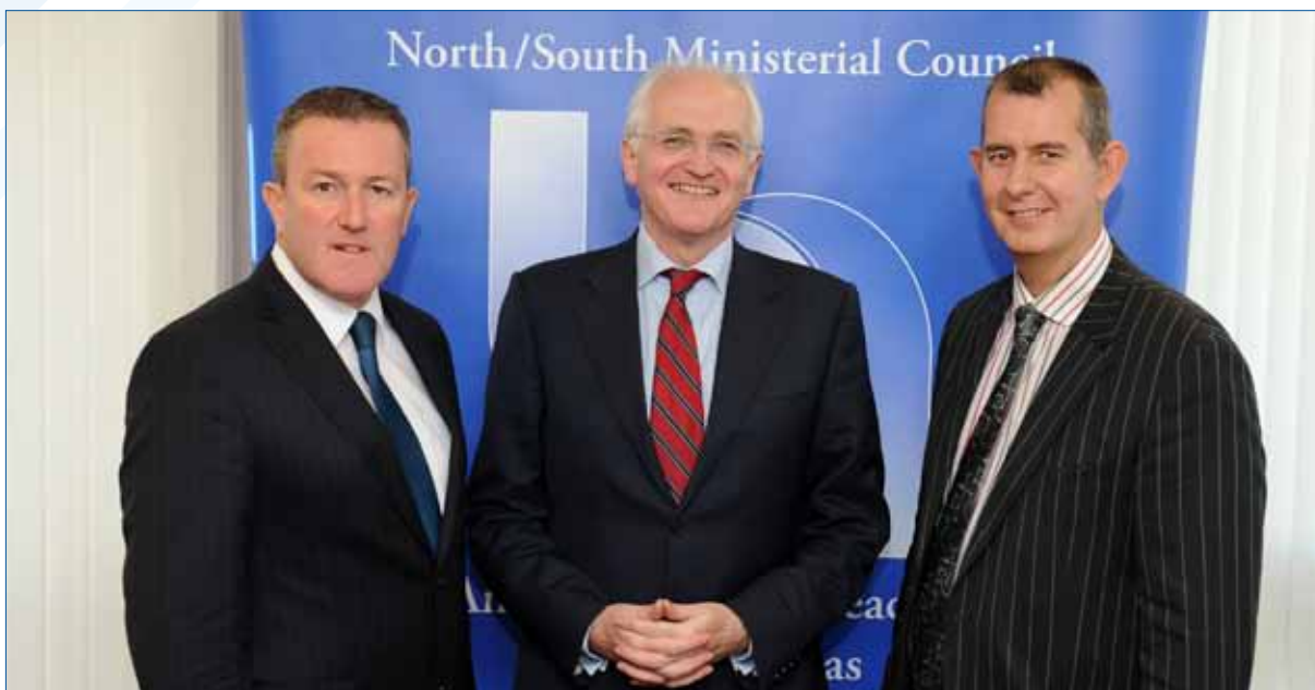
Clé go deas: Conor Murphy MP, CTR, Aire Forbartha Réigiúnaí, John Gormley TD, Aire Comhshaoil, Oidhreacht agus Rialtas Áitiúil agus Edwin Poots CTR, Aire Comhshaoil.

2.3.1 Tháinig CATT le chéile de réir fhormaid na hearnála Comhshaoil ar 5 Márta i mBaile Átha Cliath agus ar 20 Deireadh Fómhair in Ard Mhacha. D'fhreastail John Gormley TD, Aire Comhshaoil, Oidhreacht agus Rialtas Áitiúil agus Edwin Poots CTR, Aire Comhshaoil ar an dá chruinniú. D'fhreastail Margaret Richie CTR, Aire Forbartha Sóisialta ar an chruinniú i mí an Mhárta agus d'fhreastail Conor Murphy MP, CTR, Aire Forbartha Réigiúnaí ar an chruinniú i mí Dheireadh Fómhair.