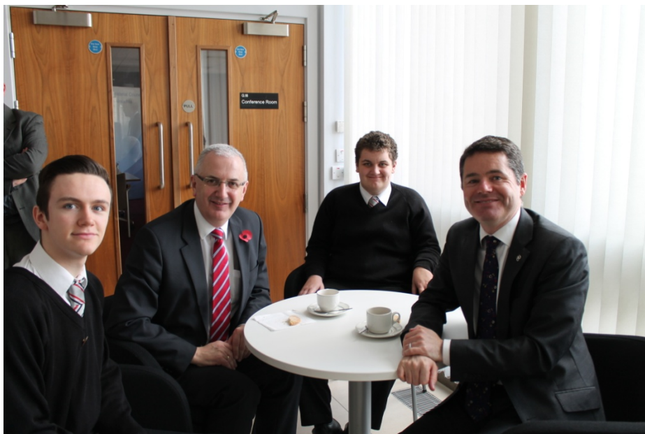
An tAire Danny Kennedy CTR agus an tAire Pascal Donohoe, TD le daltaí Lisanally ag cruinniú lompair CATT i mí na Samhna 2014.

Lean an Chomhrúnaíocht ar aghaidh lena hobair le Scoil Speisialta Lisanally in Ard Mhacha. Tugann an tionscadal thaithí oibre deis do dhaltaí cuidiú le roinnt cruinnithe CATT a shocrú agus a sholáthar. Ina measc seo tá, láithreacht nuair a thagann na Airí, ag cuidiú le réimse éagsúil dualgas ullmhúcháin agus ag cuidiú leis an lónadóireacht.