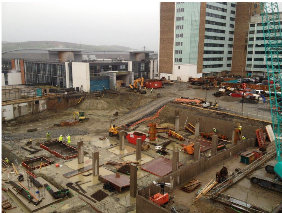
Tógáil ar siúl ag an Aonad Radaiteiripe in Otharlann Alt Mhic Dhuibhleacháin, Doire.