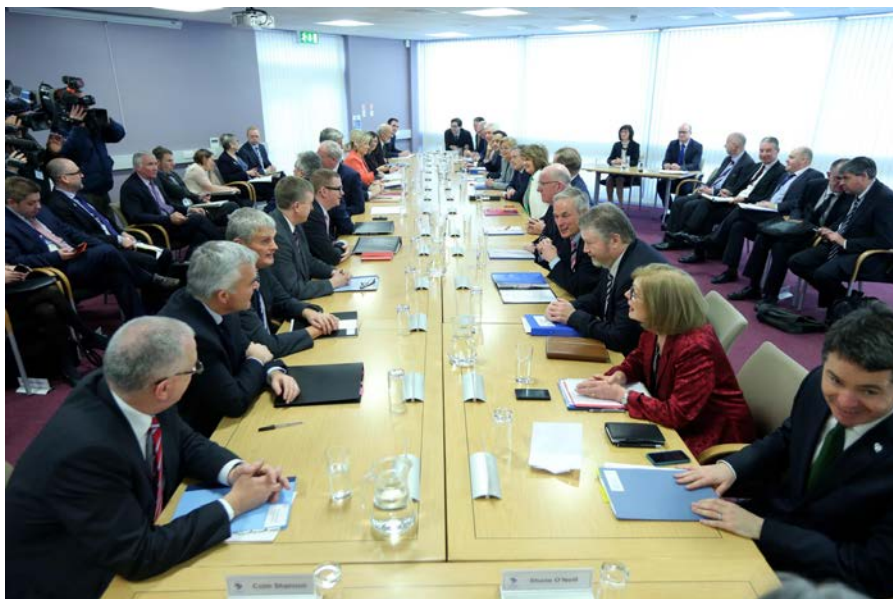
Cruinniú Iomlánach CATT in Ard Mhacha, 5 Nollaig 2014

Ag cruinnithe Iomlánacha CATT buaileann Airí Feidhmeannais lena macasamhail i Rialtas na hÉireann le maoirseacht a dhéanamh ar chomhoibriú agus obair na Comhairle Aireachta Thuaidh Theas. Bhí dhá chruinniú Iomlánacha CATT in 2014, an chéad cheann ar 3 Deireadh Fómhair i gCaisleán Bhaile Átha Cliath agus an dara ceann ar 5 Nollaig 2014 in Oifigí Chomhrúnaíocht CATT in Ard Mhacha.