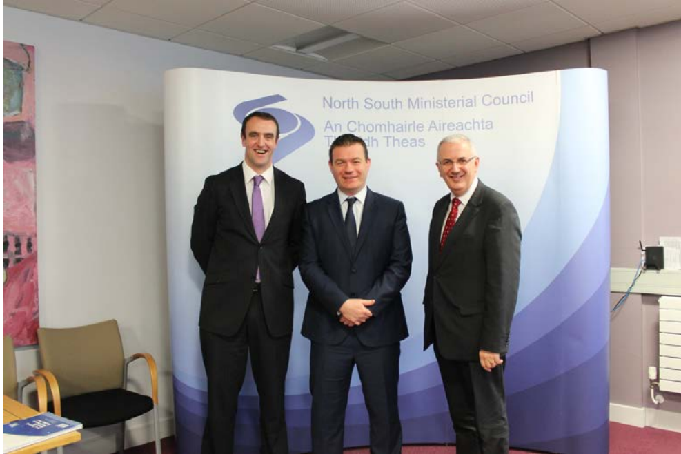
An tAire Mark H Durkan, CTR, An tAire Alan Kelly, TD agus an tAire Danny Kennedy, CTR ag cruinniú CATT ar an Chomhshaol i mí na Samhna 2014.