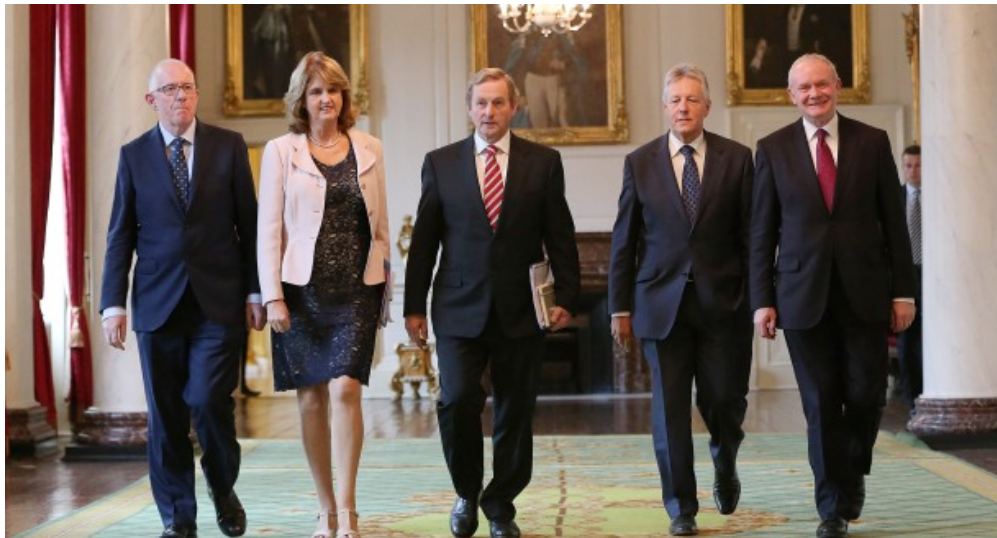
An tAire Charlie Flanagan TD, An Tánaiste Joan Burton TD, An Taoiseach Enda Kenny TD, An Chéad-Aire, An Ró-Onórach Peter Robinson CTR agus an LeasChéad-Aire Martin McGuinness CTR ag Cruinniú Iomlánach CATT i gCaisleán Bhaile Átha Cliath, 3 Deireadh Fómhair 2014