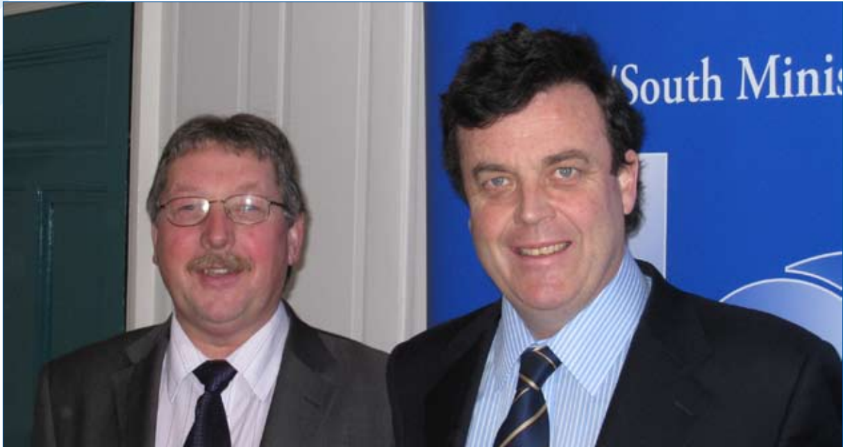
Sa phictiúr tá Airí Airgeadais Sammy Wilson, MP, MLA, agus Brian Lenihan, TD.