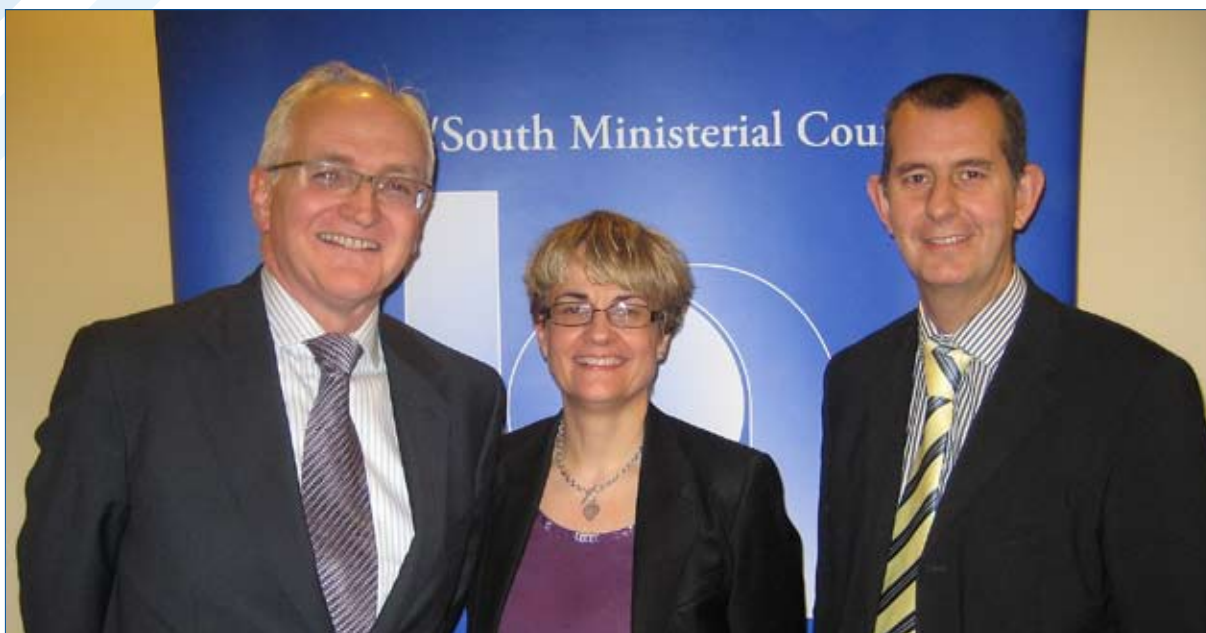
Sa phictiúr ag an gcuinniú NSMC san earnáil Comhshaoil a tionóladh an 30 Deireadh Fómhair tá John Gormley, TD, An tAire Comhshaoil, Oidhreacht agus Rialtais Áitiúil, Margaret Ritchie, MLA, An tAire Forbartha Sóisialta agus Edwin Poots, MLA, An tAire Comhshaoil.

4.3.1 Chas an NSMC le chéile i bhformáid earnála Comhshaoil an 20 Márta i mBaile Átha Cliath agus an 30 Deireadh Fómhair in Ard Mhacha. D'fhreastail John Gormley, TD, An tAire Comhshaoil, Oidhreacht agus Rialtais Áitiúil agus Margaret Ritchie, MLA, An tAire Forbartha Sóisialta ar an dá chruinniú. D'fhreastail Sammy Wilson, MP, MLA, An tAire Comhshaoil ar chruinniú mhí an Mhárta agus d'fhreastail Edwin Poots, MLA, An tAire Comhshaoil ar chruinniú mhí Dheireadh Fómhair.