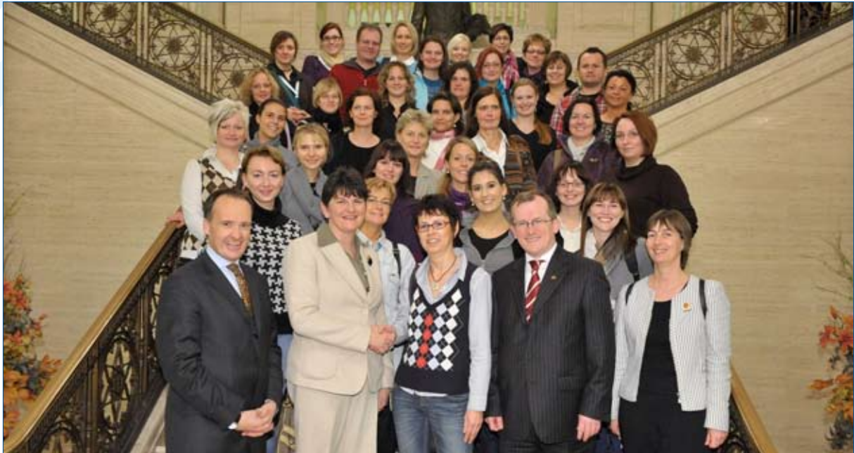
Fáiltíonn an tAire Fiontar, Trádála agus Infheistíochta, Arlene Foster, MLA roimh ghrúpa de ghníomhairí taistil as an nGearmáin chuig Árais na Parlaiminte