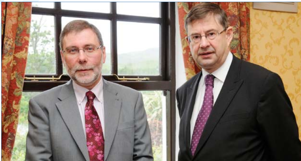
Sa phictiúr tá Nelson McCausland, MLA, an tAire Cultúir, Ealaíon agus Fóillíochta agus Éamon Ó Cuív, TD, an tAire Gnóthaí Pobail, Tuaithe agus Gaeltachta ag Cruinniú na Comhairle Aireachta Thuaidh Theas, i bhformáid eárnála Teanga, an 9 Iúil.