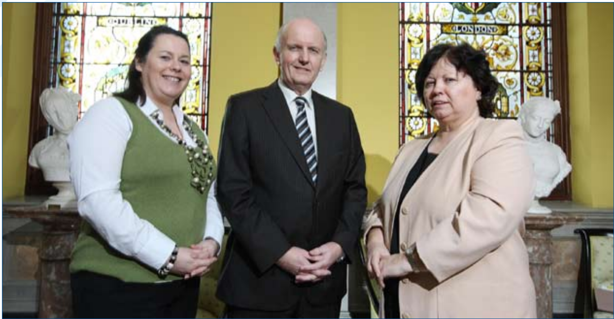
Sa phictiúr ag an gcuinniú NSMC a reáchtáladh an 25 Samhain tá Michelle Gildernew, MP, MLA, An tAire Talmhaíochta agus Forbartha Tuaithe, Michael McGimpsey, MLA, An tAire Sláinte, Seirbhísí Sóisialta agus Sábháilteachta Poiblí agus Mary Harney, TD, An tAire Sláinte agus Leanaí.

4.4.1 Chas an NSMC i bhformáid eárnála Sláinte le chéile i mBaile Átha Cliath an 10 Meitheamh agus i mBéal Feirste an 25 Samhain. D'fhreastail Mary Harney, TD, An tAire Sláinte agus Leanaí, Michael McGimpsey, MLA, An tAire Sláinte, Seirbhísí Sóisialta agus Sábháilteachta Poiblí agus Michelle Gildernew, MP, MLA, An tAire Talmhaíochta agus Forbartha Tuaithe ar an dá chruinniú. D'fhreastail Barry Andrews, TD, An tAire Leanaí agus Gnóthaí Óige ar chruinniú mhí an Mheithimh freisin.