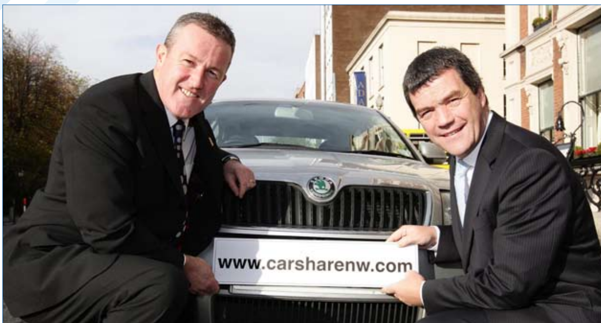
Ag seoladh an láithreáin ghréasáin ar roinnt carranna don réigiún Thiar Thuaidh, a fhaigheann comhthacaíocht, tá Conor Murphy, MP, MLA, an tAire Forbartha Réigiúnaí agus Noel Dempsey, TD, An tAire Iompair

4.6.1 Bhuail an NSMC le chéile i bhformáid earnála lompair i Latharna an 3 Aibreán agus sa Bheart an 4 Samhain. D'fhreastail Noel Dempsey, TD, An tAire Iompair agus Conor Murphy, MP, MLA, an tAire Forbartha Réigiúnaí ar an dá chruinniú. D'fhreastail Sammy Wilson, MP, MLA, ar chruinniú Mhí Aibreáin agus d'fhreastail an duine a tháinig i gcomharbacht air mar Aire Comhshaoil, Edwin Poots, MLA, ag cruinniú Mhí na Samhna.