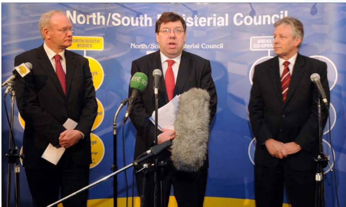
Sa phictiúr ag cruinniú iomlánach NSMC in Ollscoil Uladh ag Magee an 23 Eanáir tá an LeasChéad-Aire Martin McGuinness, MP, MLA, An Taoiseach Brian Cowen, TD, agus an Chéad Aire an Ró-Onórach Peter Robinson, MP, MLA.

2.1 Thionóil an NSMC cruinniú iomlánach in Eanáir 2009 ag Ollscoil Uladh ag Magee, i mí Iúil 2009 ag Teach Farmleigh, Baile Átha Cliath agus i mí na Nollag 2009 i Léim an Mhadaidh. Ag gach aon cheann de na cruinnithe sin, ba é an Taoiseach, Brian Cowen, TD a stiúraigh toscaireachtaí Rialtas na hÉireann agus ba é an Ró-Onórach Peter Robinson, MP, MLA agus an LeasChéad-Aire, Martin McGuinness, MP, MLA a stiúraigh toscaireachtaí Fheidhmeannas Thuaisceart Éireann. Is féidir na Teachtaireachtaí Comhpháirteacha a eisíodh i ndiaidh na gcrúinnithe sin go léir a fháil ag www.northsouthministerialcouncil.org .