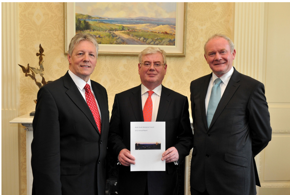
An Chead – Aire, Tanáiste agus an Leas-Chéad-Aire ag seoladh Tuarascáil Bhliantuil CATT ag an Chruinniú Institiúdeach i Mí Aibreáin.

Tháinig CATT le chéile i bhformáid Institiúdeach ar 29 Aibreán 2013 i gCaisleán Stormont, Béal Feirste. Ag an chruinniú bhí an Chéad-Aire an Ró-Onórach Peter Robinson CTR, an Leas-Chéad-Aires Martin McGuinness CTR agus an Tánaiste agus Aire Gnóthaí Eachtracha agus Trádála, Eamon Gilmore TD. Tá cóip den Chomhráiteas a eisíodh i ndiaidh an chruinnithe le fáil in www.northsouthministerialcouncil.org