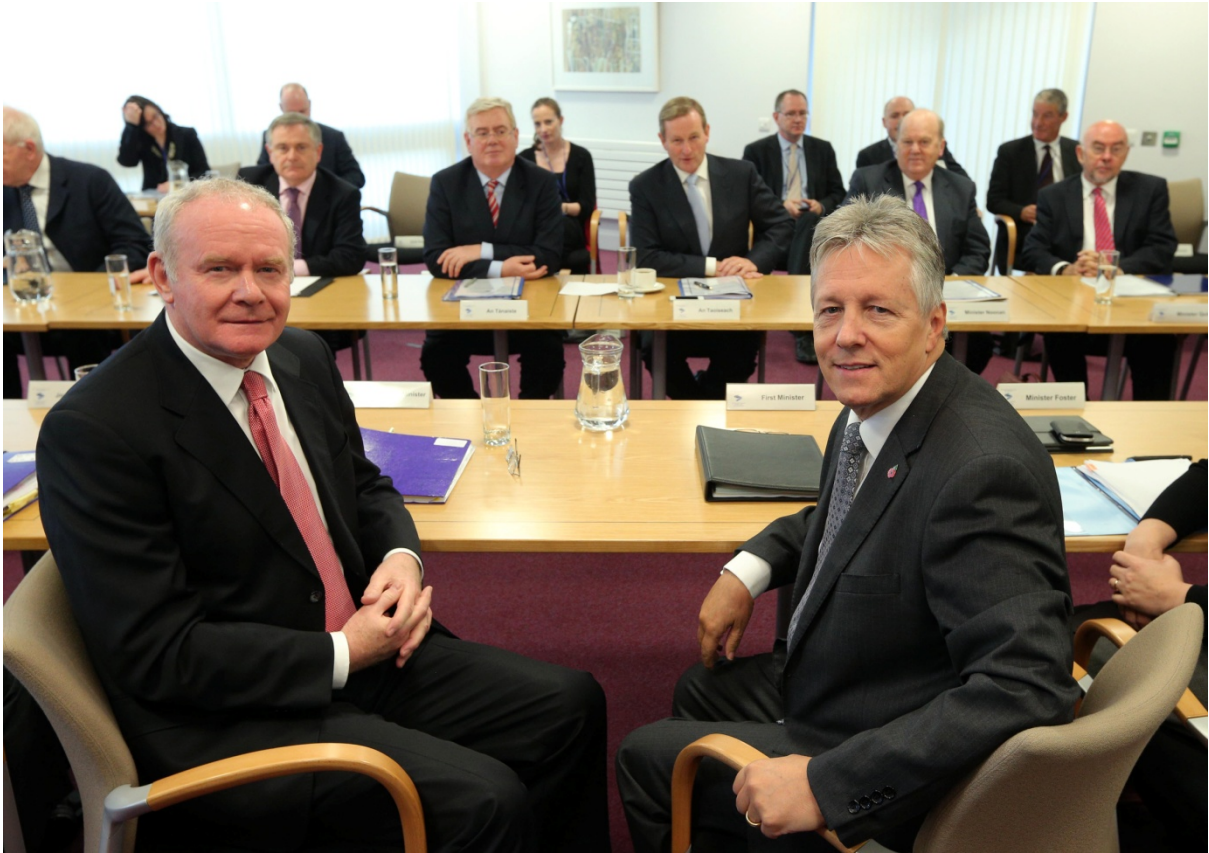
Toscairí ag an chruinniú Iomlánach CATT in Ard Mhacha 8 Samhain 2013

Ag cruinnithe iomlánacha CATT buaileann Airí Feidhmeannais lena macasamhail i rialtas na hÉireann le maoirseacht a dhéanamh ar chomhoibriú agus obair na Comhairle Aireachta Thuaidh Theas. Bhí dhá chruinniú iomlánacha CATT in 2013, an chéad cheann ar 5 Iúil i gCaisleán Bhaile Átha Cliath agus an dara ceann ar 8 Samhain 2013 in Oifigí Comhrúnaireachta CATT in Ard Mhacha.