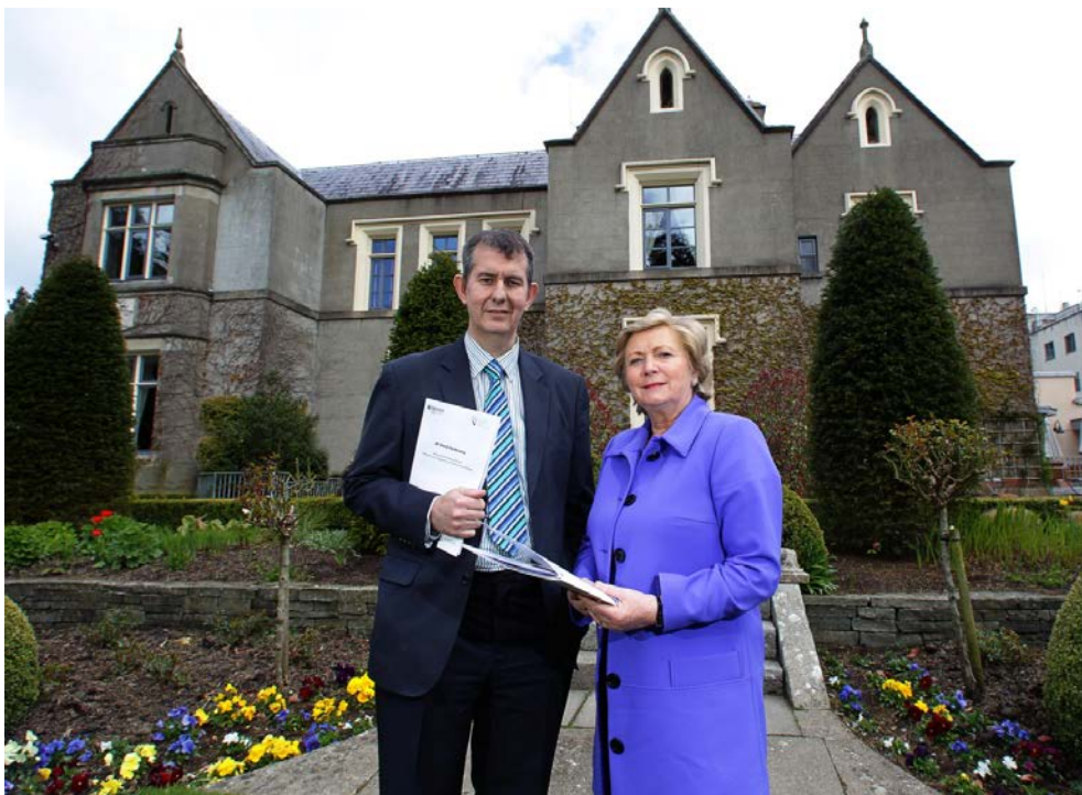
An tAire Poots agus an tAire Fitzgerald ag an Chomhdháil um Chosaint Leanaí i nDún Dealgan, Bealtaine 2013