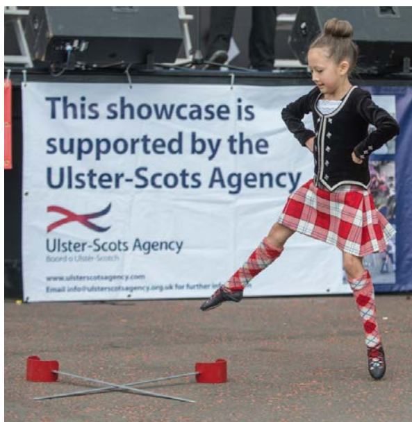
The Lagan Hooley – ócáid Ultaise