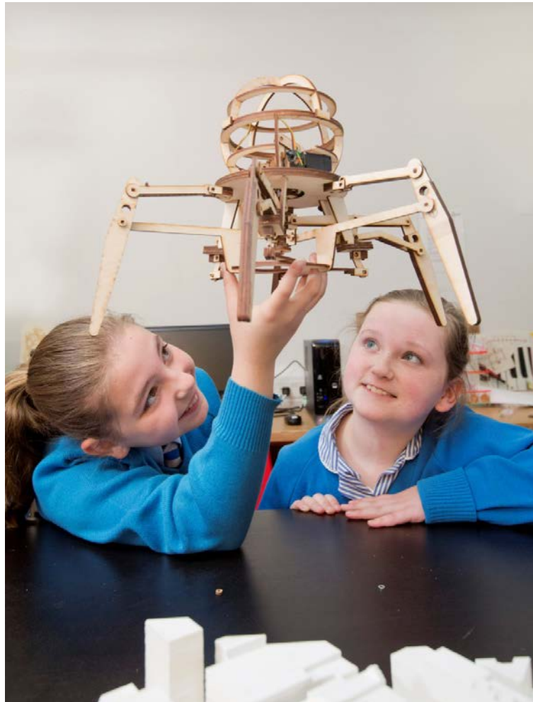
Daltaí bunscoile ar cuairt ag Fab Lab i mBéal Feirste maoinithe ag Clár PEACE III