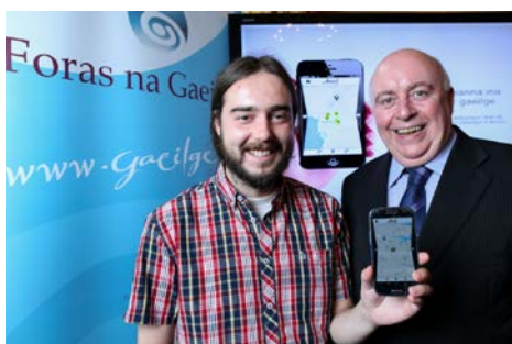
Seoladh app na Gaeilge

D'aithin na hAirí an chomhbair leanúnach le hoifigí neamhspleácha na n-Ardreachtairí & na bPríomhíniúcháirí sa dá dhlínse. Mar thoradh air seo, foilsíodh 11 Tuascáil agus Cuntas Bhliantúil chomhdhlúthaithe don Fhoras Teanga idir 2005 agus seo.