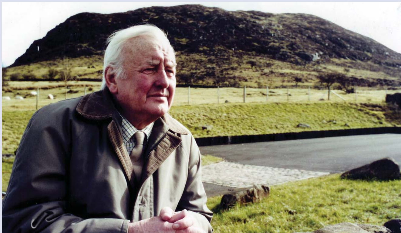
Is é James Fenton, file agus údar, urlabhraí aitheanta na hUltaise, an 'hamely tongue' mar a ghlaonn sé féin uirthi. Tá sé ina sheasamh agus a chúl aige le Sliabh Mis i gContae Aontrama - contae a luann sé go minic ina chuid filíochta.