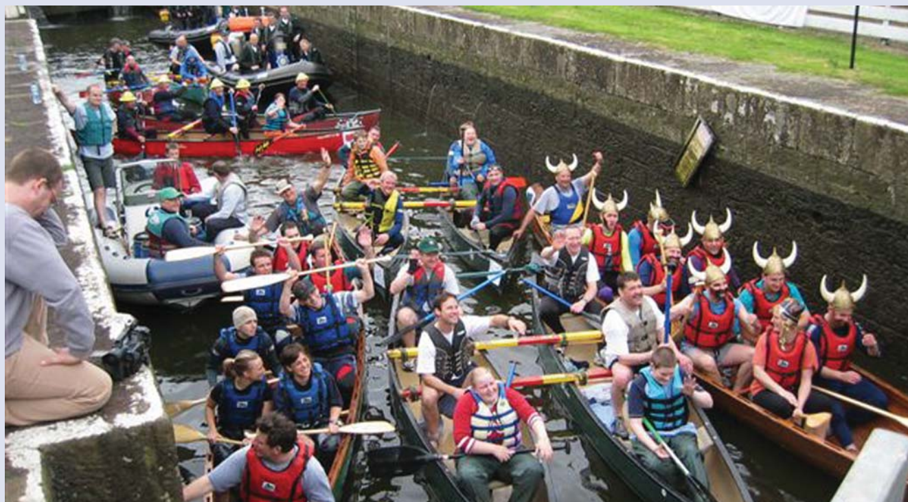
Dúshlán Canúna na gCluichí Oilimpeacha Speisialta ar Abhainn na Banna Íochtair.